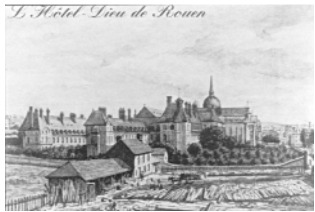
Figure 3. L'Hôtel Dieu de Rouen, vue par A. Vilain en 1850.

Le déroulement de l'opération de la taille latérale au grand appareil est le suivant : l'opérateur introduit une sonde métallique (fer ou argent) dans l'urèthre puis la vessie. Il incise ensuite le périnée jusqu'à prendre contact avec la sonde au niveau de l'urèthre prostatique et du col vésical. Vient alors l'introduction du