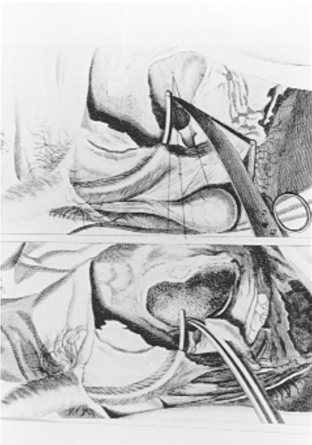
Figure 2. La taille vésicale selon Le Cat.

En haut : Le Gorgeret-cystotome élargit l'incision du col vésical.