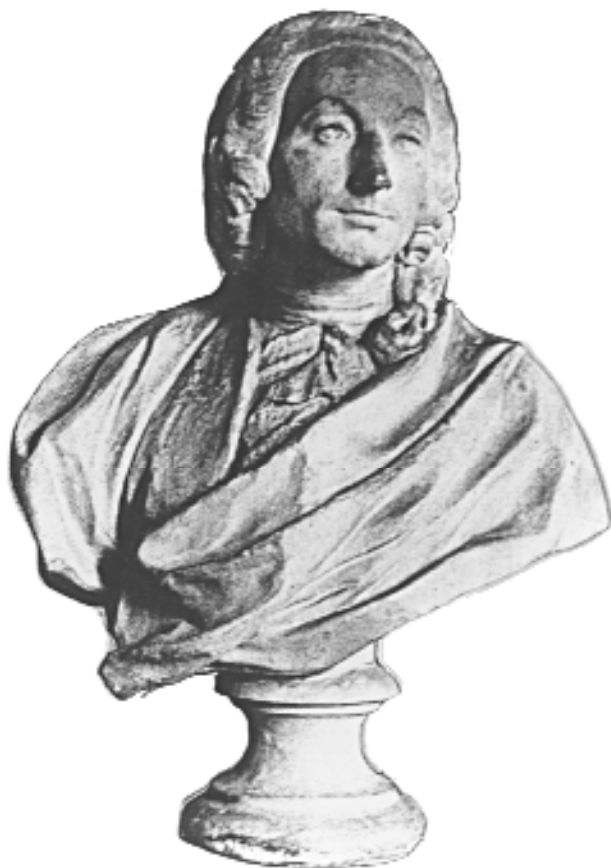
Figure 1. Claude-Nicolas Le Cat par J.B. Lemoyne.

alors que les chirurgiens des villes tel Rouen doivent passer 14 examens soit "le grand chef d'oeuvre" pour avoir le droit d'exercer.